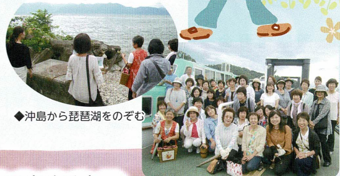
◆沖島から琵琶湖をのぞむ