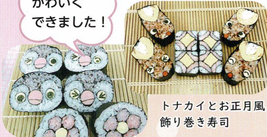
トナカイとお正月風 飾り巻き寿司