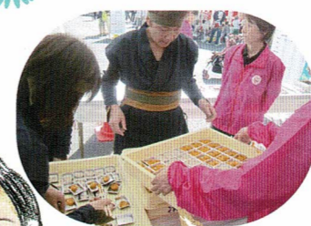
手裏剣投げコーナー