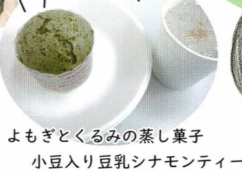
よもぎとくるみの蒸し菓子 小豆入り豆乳シナモンティー