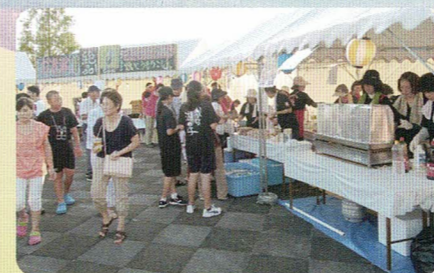
◆和太鼓サウンド出店

2年間で振り返ると甲賀市の魅力再発見の観光ツアーで、其々のお寺のご住職様や奥様のおもてなしが大変勉強になりました。又、未来創造事業の食・観・学と勉強させて頂き、滋賀ってなにもない所だと思っていましたが、忍や歴史など学び葉膳料理やサムライ剣舞も奥深く、滋賀を誇らしく思います。商工会女性部の今後のご活躍をお祈りします。