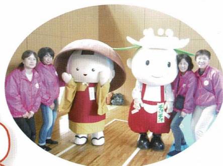
ご当地キャラと女性部員でお出迎え。