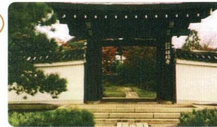
一休和尚ゆかりの寺院 祥瑞寺