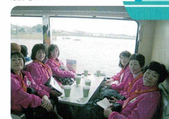
堅田港より船に乗り琵琶湖大橋をくぐり遊覧しました。